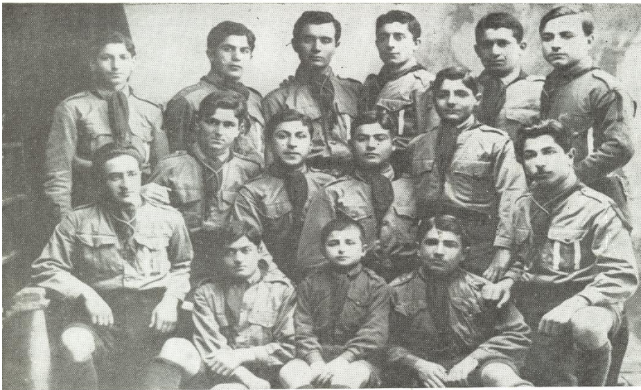
Ինքնապաշտպանությանը մասնակցած և ցեղասպանությունից մազապուրծ շապինգարահիսարցի մի խումբ երիտասարդներ