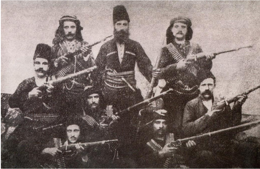
Շապին-Գարահիսարի ինքնապաշտպանությանը մասնակցած հայ մարտիկների մի խումբ