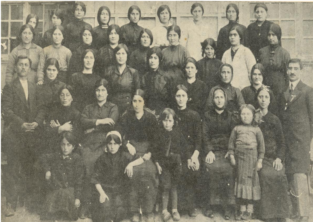
Հայոց ցեղասպանությունը վերապրած շապինգարահիսարցի աղջիկներ