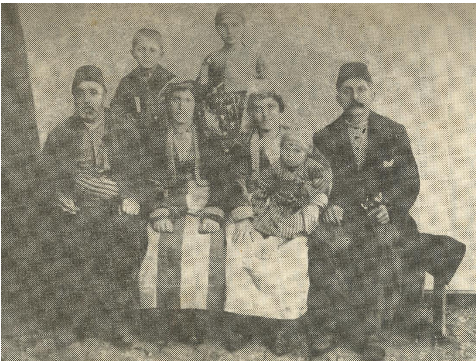
Շապին-Գարահիսարի տարագրվ նկարված ընտանեկան լուսանկար