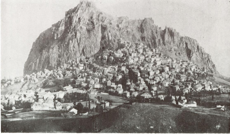
Շապին Գարահիսար քաղաքի համայնապատկերը և բերդը, 1900-ականներ