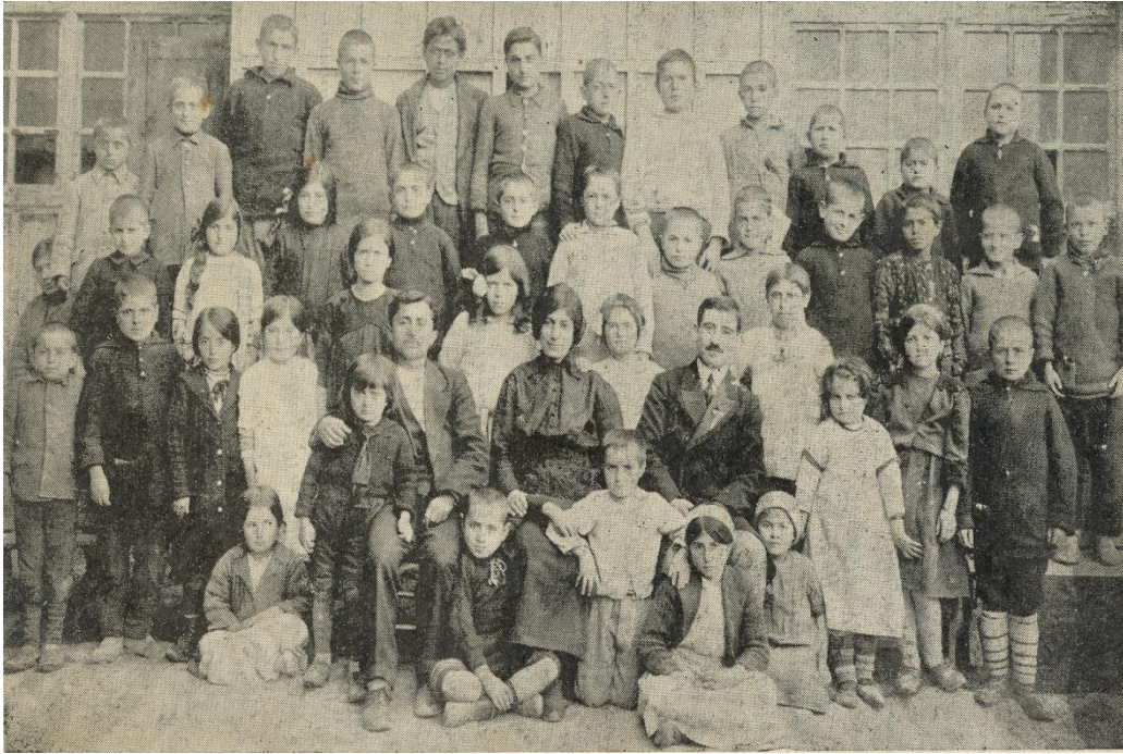
Շապին-Գարահիսարցի որբեր, Սեբաստիա